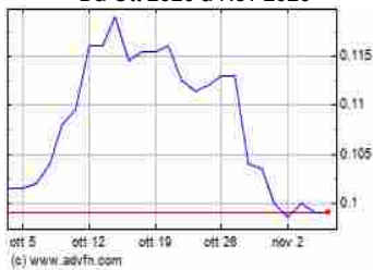
Grafico Azioni Class Editori (BIT:CLE) Storico Da Ott 2020 a Nov 2020