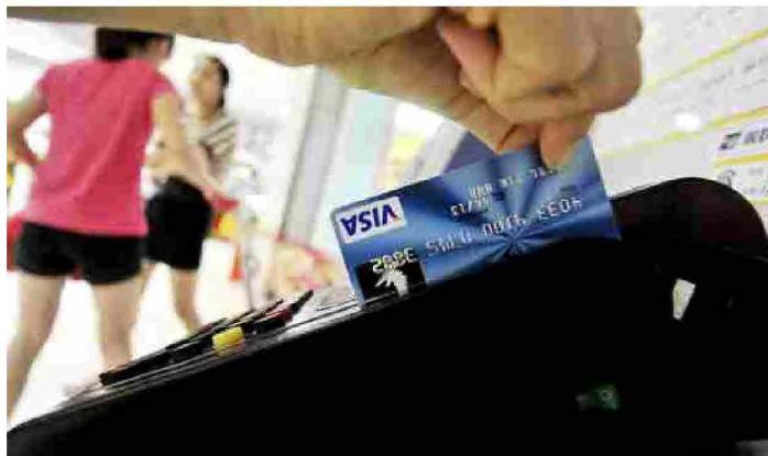
Pagamenti digitali