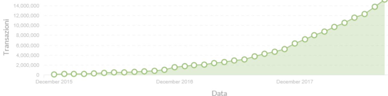
PagoPa andamento transazioni