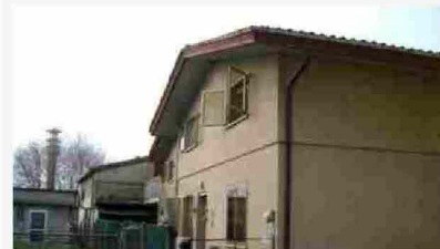
Portogruaro - 33107

Vendite giudiziarie - La Nuova Venezia Tribunale di Venezia