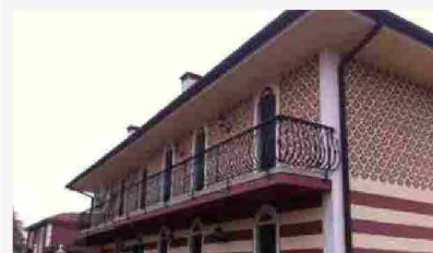
Venezia Via Colombara 213 - 973265

Proprio per indagare la dialettica tra digitale e reale nel mondo di oggi, Enterprise inaugura al Salone dei Pagamenti la serie di talk Materiale/Immateriale: quattro appuntamenti in cui professionisti di discipline trasversali discuteranno in questa chiave dell'attualità. Dopo il primo talk, il 5 novembre, sulla piattaforma del Salone dei Pagamenti seguiranno gli altri in programma sui canali di Enterprise.