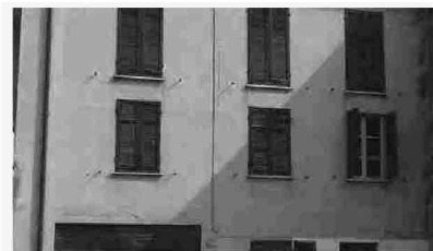
Appartamenti Retorbido Voghera - 39262

Proprio per indagare la dialettica tra digitale e reale nel mondo di oggi, Enterprise inaugura al Salone dei Pagamenti la serie di talk Materiale/Immateriale: quattro appuntamenti in cui professionisti di discipline trasversali discuteranno in questa chiave dell'attualità. Dopo il primo talk, il 5 novembre, sulla piattaforma del Salone dei Pagamenti seguiranno gli altri in programma sui canali di Enterprise.