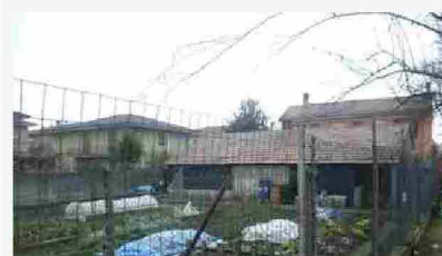
Appartamenti Mede Martiri della Libertà - 27690