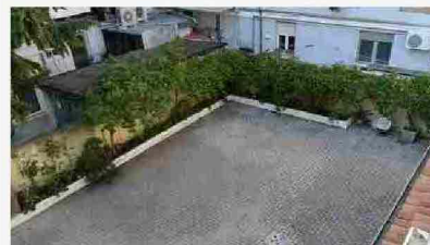
Grado - 10250

Tribunale di Trieste Tribunale di Gorizia