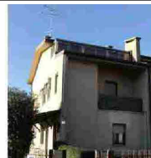
Appartamenti Marin Sanudo - 119500

Proprio per indagare la dialettica tra digitale e reale nel mondo di oggi, Enterprise inaugura al Salone dei Pagamenti la serie di talk Materiale/Immateriale: quattro appuntamenti in cui professionisti di discipline trasversali discuteranno in questa chiave dell'attualità. Dopo il primo talk, il 5 novembre, sulla piattaforma del Salone dei Pagamenti seguiranno gli altri in programma sui canali di Enterprise.