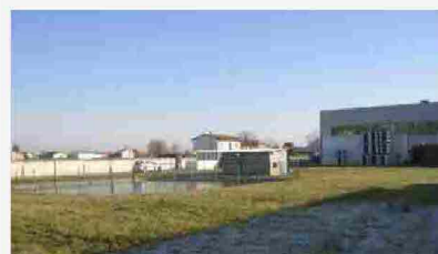
Terreni Pianiga VE 5000 mq, - 39950

Vendite giudiziarie - Il Corriere delle Alpi