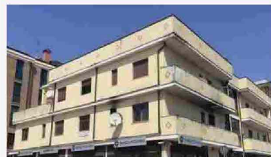
Appartamenti Conselve Castello 1 (angolo Fossalta) - 30000

Proprio per indagare la dialettica tra digitale e reale nel mondo di oggi, Enterprise inaugura al Salone dei Pagamenti la serie di talk Materiale/Immateriale: quattro appuntamenti in cui professionisti di discipline trasversali discuteranno in questa chiave dell'attualità. Dopo il primo talk, il 5 novembre, sulla piattaforma del Salone dei Pagamenti seguiranno gli altri in programma sui canali di Enterprise.