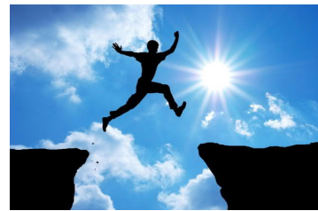
CAMBIAMENTO / TRANSIZIONE