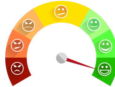
ROI Customer Satisfaction Portfolio