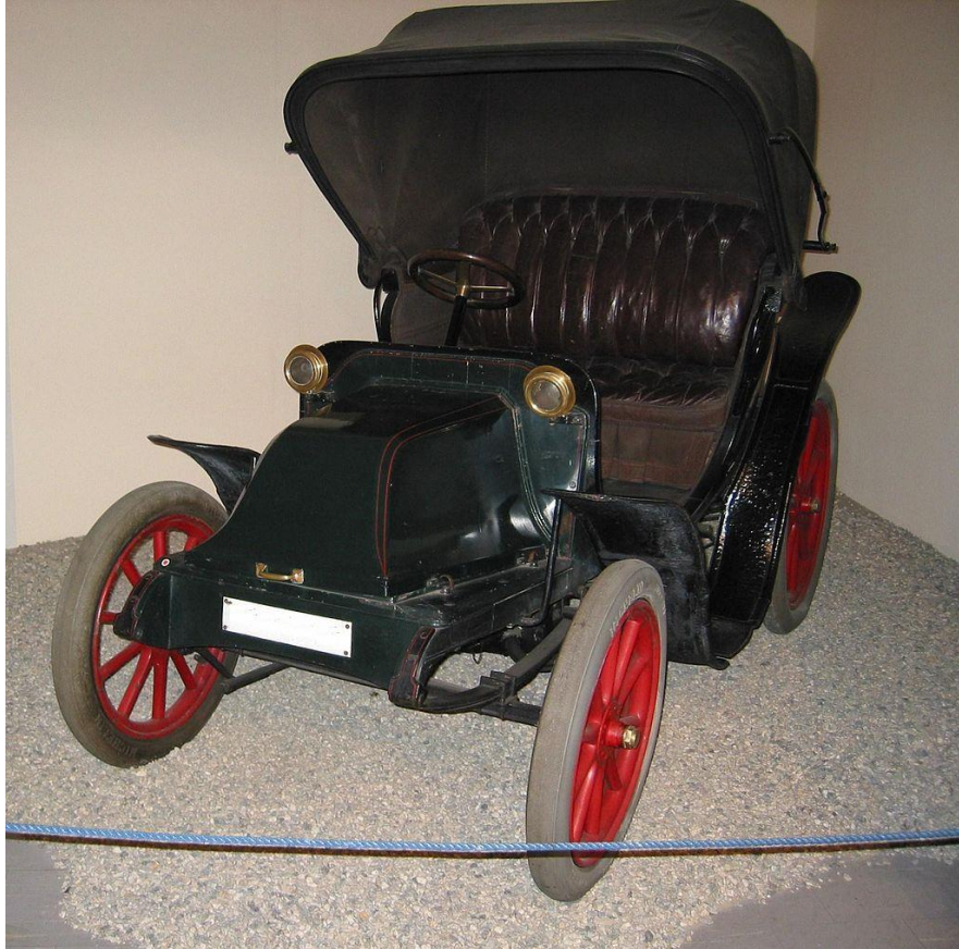
STAE 1909: - Elettrica - 10 hp - 90 km di autonomia