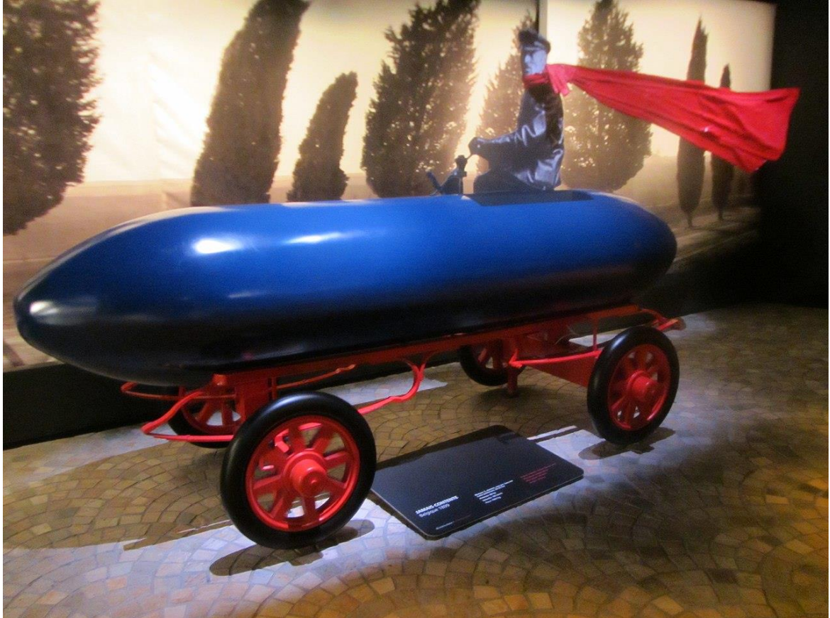
La Jamais Contente 1899: Il primo veicolo a raggiungere i 100 km/h era elettrico